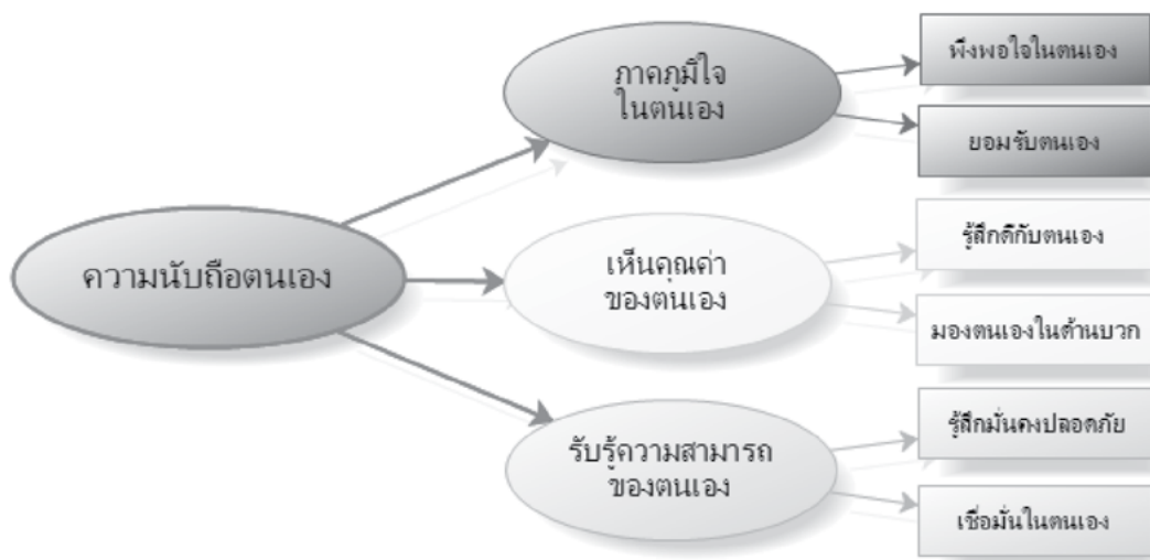
รูปที่ 1 องค์ประกอบความนับถือตนเอง

องค์ประกอบที่ชัดเจนและตรงตามสภาพจริงมากที่สุด โดยอาศัยกรอบแนวคิดเชิงมานุษยนิยมของ Rogers และ Coopersmith (Rogers, 1959; Coopersmith, 1967) ที่เชื่อว่าความนับถือตนเองประกอบด้วย 3 องค์ประกอบ ได้แก่ ความภาคภูมิใจในตนเอง (Self-proud Factors) การเห็นคุณค่าของตนเอง (Self-respect Factors) และการรับรู้ความสามารถของตนเอง (Self-efficacy Factors) (ดังรูปที่ 1)