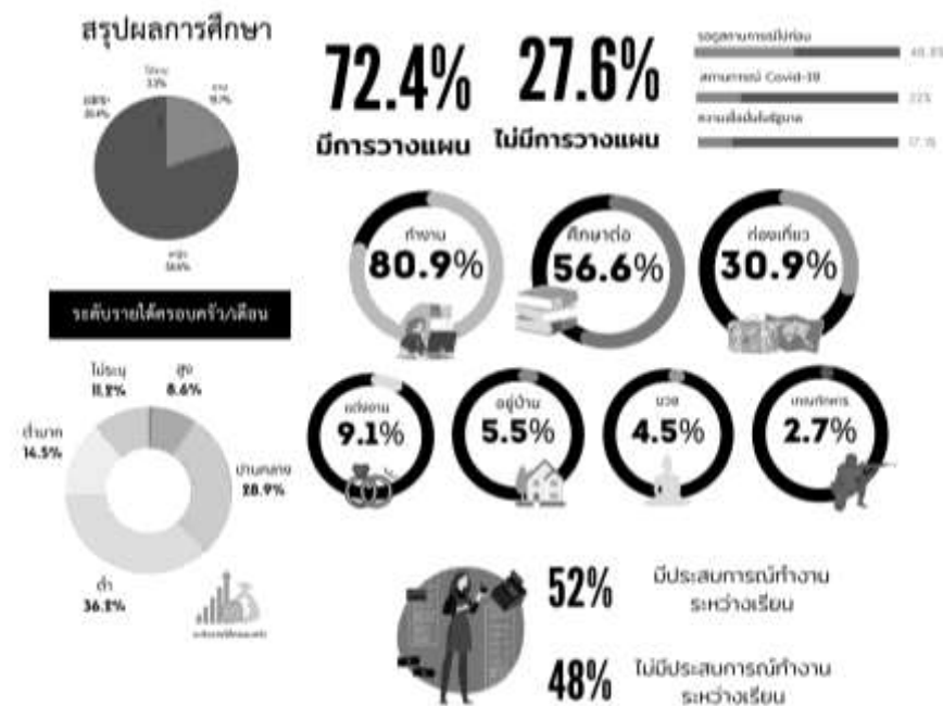
รูปภาพที่ 1 สรุปผลการศึกษา

จากจำนวนกลุ่มตัวอย่างนักศึกษาชั้นปีสุดท้ายมหาวิทยาลัยธรรมศาสตร์ ศูนย์รังสิตที่ได้ทำการเก็บข้อมูลจากแบบสอบถามออนไลน์ (Online Survey) ซึ่งเป็นเครื่องมือเพื่อใช้ในการตอบคำถามวิจัยและตอบวัตถุประสงค์ที่กำหนดจำนวนไว้ 152 คน พบว่า ข้อมูลที่ได้เป็นเพศหญิง ร้อยละ 56.6 และ LGBTQ+ ร้อยละ 20.4 ซึ่งมากกว่าเพศชายที่มีจำนวนร้อยละ 19.7 คณะของนักศึกษาชั้นปีสุดท้ายที่ได้ข้อมูลมากที่สุด คือ คณะศิลปศาสตร์ คิดเป็นร้อยละ 11.8 ในขณะที่วิทยาลัยพัฒนศาสตร์ ป๋วย อึ๊งภากรณ์ และคณะเภสัชศาสตร์ คือ คณะที่ได้ข้อมูลน้อยที่สุดคิดเป็นร้อยละ 0.7 นอกจากนี้ยังพบคณะที่ไม่ได้ข้อมูลอีกด้วย คือ คณะศิลปกรรมศาสตร์ คณะสาธารณสุข คณะแพทยศาสตร์ วิทยาลัยโลกคดีศึกษา จากการสอบถามการวางแผนหลังจบการศึกษาของนักศึกษาระดับปริญญาตรี พบว่า กลุ่มตัวอย่างเลือกไปทำงานหลังเรียนจบการศึกษามากที่สุดคิดเป็นร้อยละ 80.9 และบวชน้อยที่สุดคิดเป็นร้อยละ 4.5